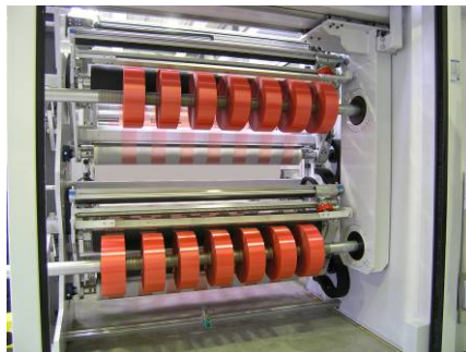
2-Stellen Aufwicklung auf Friktionswellen