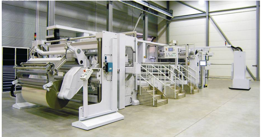
Umrollmaschine für Papiere und Folien unter Reinraumbedingungen