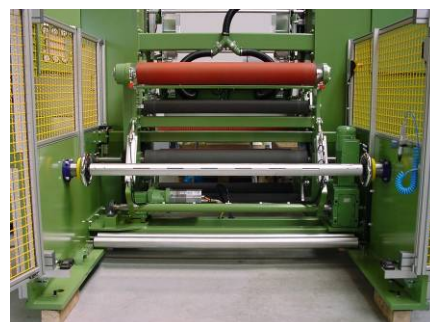
Abwickelstelle für Off-line Betrieb

Die durchdachte Steuerung der gesamten Maschine sorgt für eine Entlastung des Bedienpersonals und die hohe Effektivität eines SOMATEC Kurzrollenwicklers.