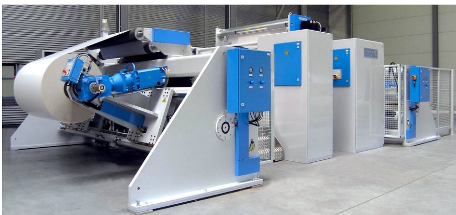
Umrollmaschine für Verbundmaterial