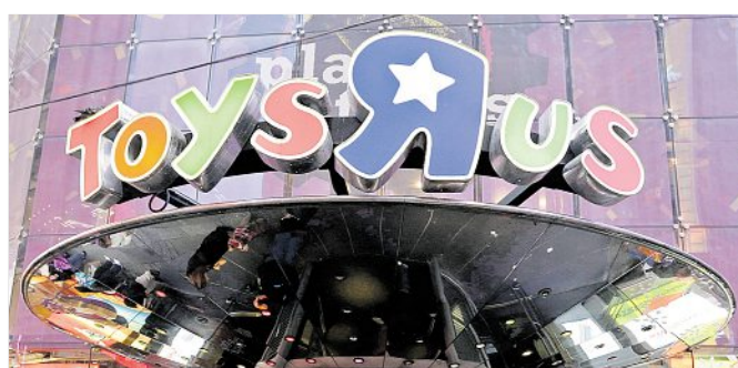
Toys R Us gibt in Amerika auf – nach 70 Jahren. Der Onlinehandel zwang den einstigen Spielzeugriesen in die Knie.