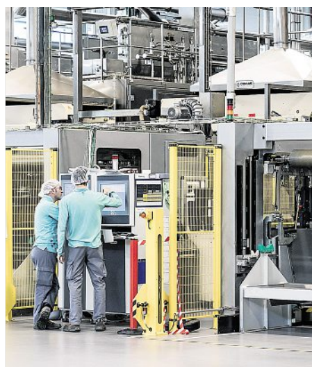
Arbeit mit Haube: Vor allem junge Männer bedienen die Maschinen in Italien.

Geschult werden die Mitarbeiter der neuen Fabrik in Italien. Dafür nehme der Konzern viel Geld in die Hand, berichtet Gewerkschafter Heinrich. Er hofft, dass die neue Fabrik nach dem Tarifvertrag der Zigarettenindustrie zahlen wird – auch wenn die Stäbchen nicht mehr Zigarette heißen.