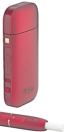
Technik für Raucher, die auf Erhitzen umsteigen: Das Gerät Iqos aus Malaysia wird mit Strom aufgeladen – und mit Tabakstäbchen als Wegwerfprodukt.

Der Grundstoff ist jedoch weiterhin Tabak mit Nikotin, das süchtig macht – eine Mitarbeiterin im weißen Kittel zeigt die Tabakblätter in einer Vitrine im Eingang zur Fabrik. Dort hat der Konzern einen Ausstel-